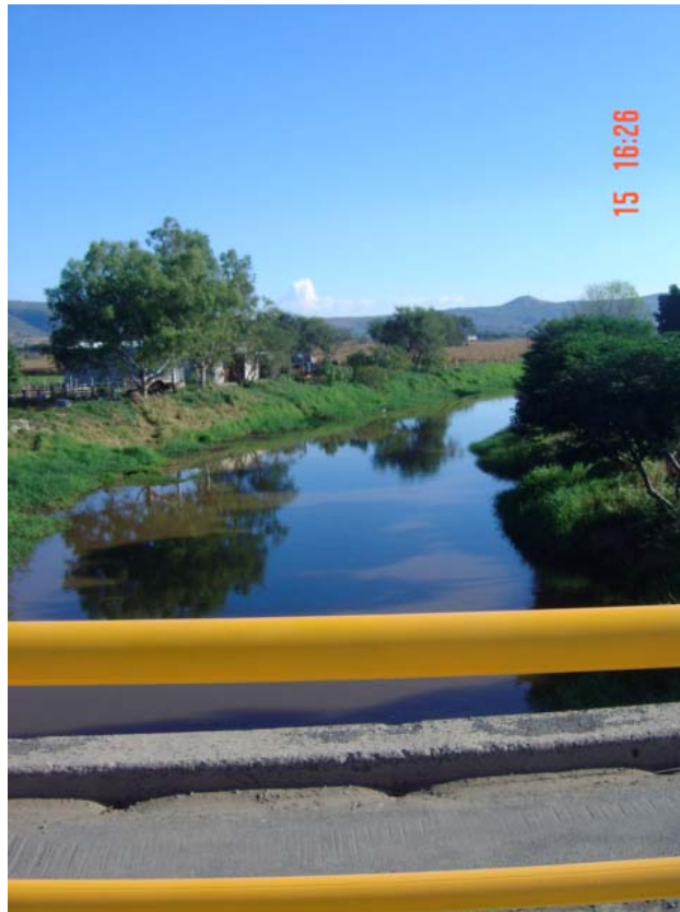
Figura 3-7 Río Santiago en Cuitzeo