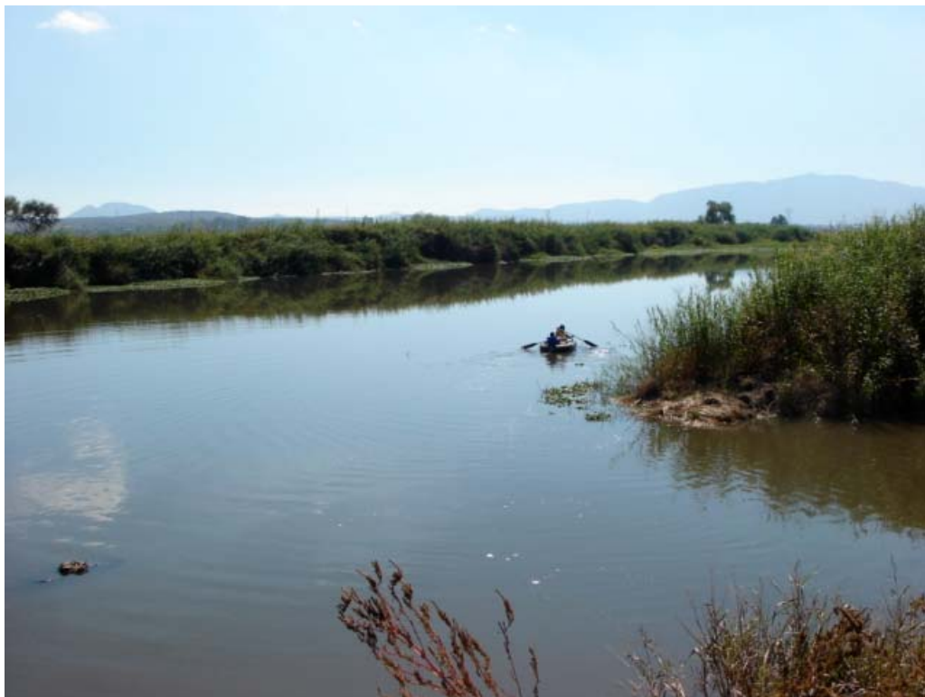
Figura 3-13 Arroyo del Ahogado en El Muelle