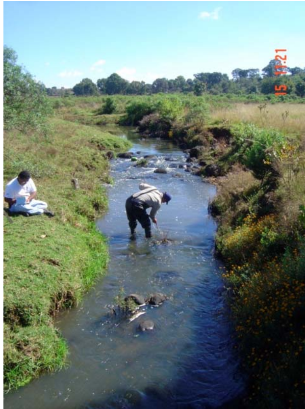
Figura 3-3 Río Zula en Rinconada de Cristo Rey