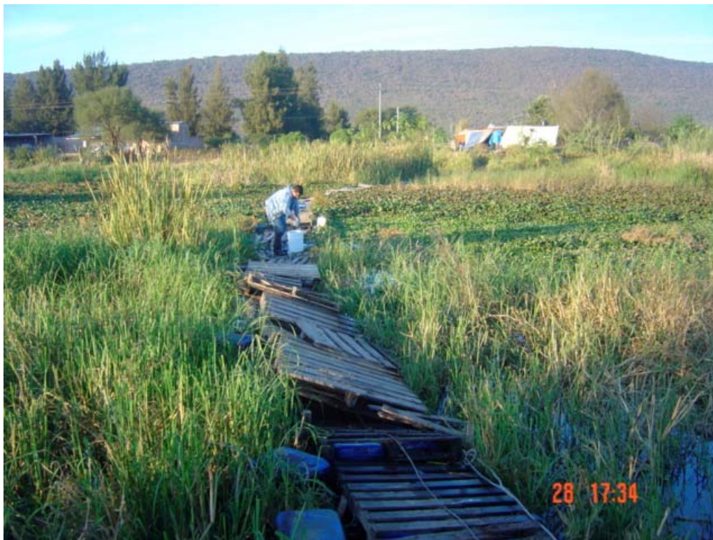
Figura 3-9 Río Santiago aguas debajo de las compuertas de Poncitlán