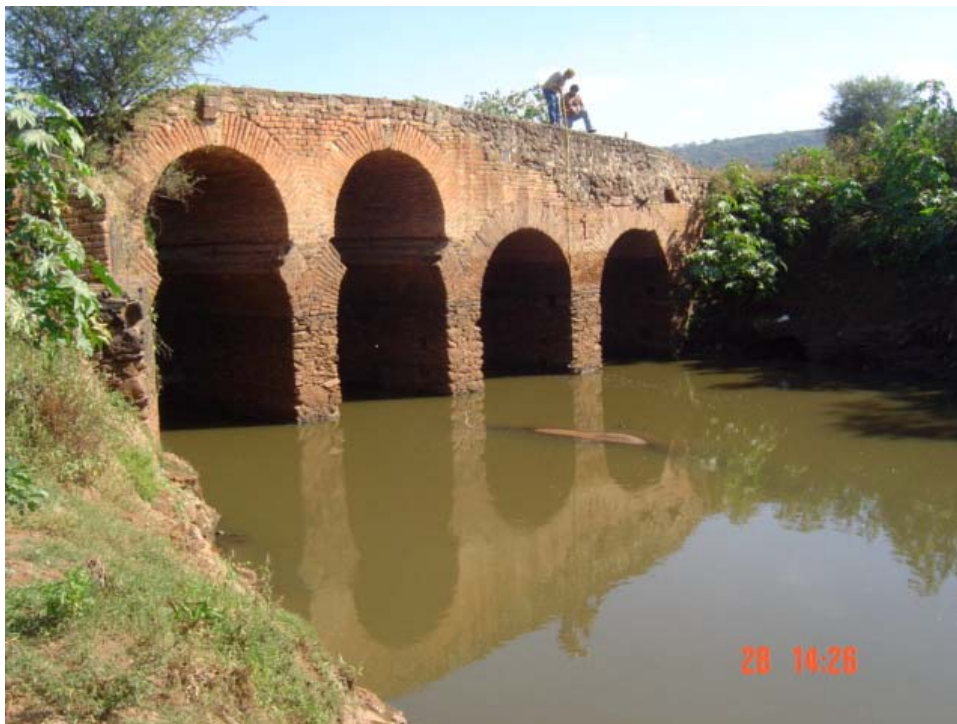
Figura 3-5 Arroyo Chico en Ríos de Ruiz