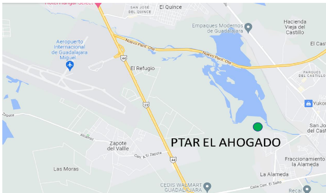
Figura 1. – Localización del sitio de las obras

La localización de las obras del PROYECTO será en los terrenos de AMPLIACIÓN DE LA PTAR EL AHOGADO, que se localiza a 3.6 km de distancia del aeropuerto internacional Miguel Hidalgo como se puede observar en la Figura 1.