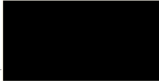
ADMINISTRADOR GENERAL ÚNICO