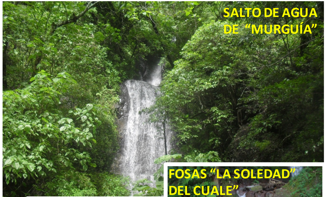
SALTO DE AGUA DE "MURGUÍA"