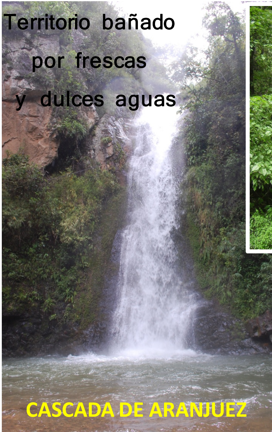
CASCADA DE ARANJUEZ

Territorio bañado por frescas y dulces aguas