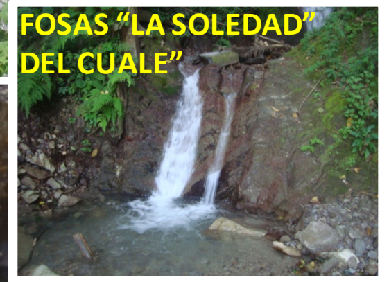
FOSAS "LA SOLEDAD" DEL CUALE"