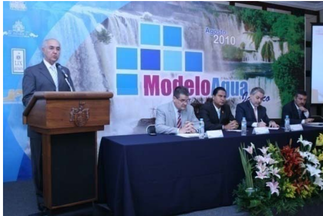
“LA PROBLEMÁTICA DE LOS SERVICIOS Y SU IMPACTO EN LA SOCIEDAD Y EL MEDIO AMBIENTE”