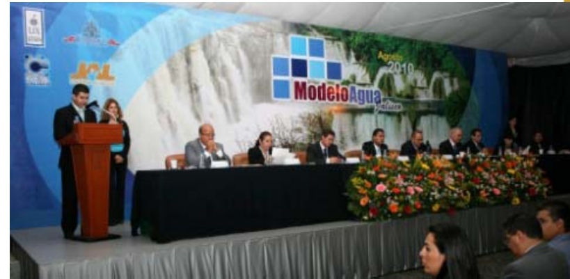
“LA PARTICIPACIÓN DE LA FEDERACIÓN Y GRUPOS ESPECIALIZADOS EN LA GESTIÓN DEL AGUA”